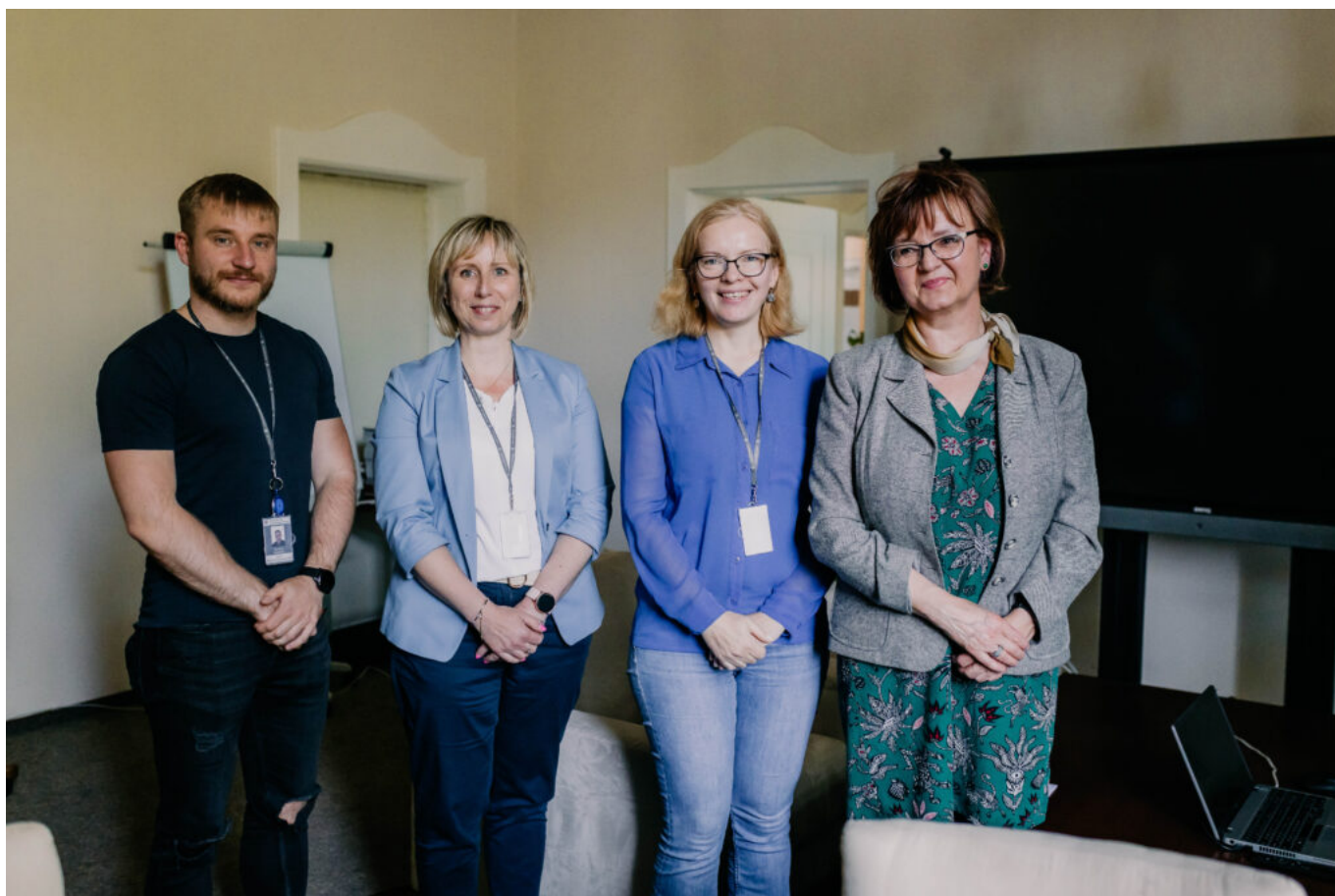
Wizyta studentów UAM w siedzibie Biura Geodety Województwa